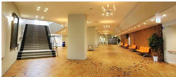
大ホールホワイエ